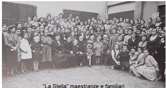
"La Stella" maestranze e familiari

La ditta Lenti Carlo (La Dominante) è la prima a produrre in Italia la scarpa di gomma vulcanizzata, occupando sino alla seconda guerra mondiale il primo posto in questo campo nel mercato nazionale, e pare che abbia avuto alle dipendenze più di 300 lavoratori. I sandali della Ettore Pavesi sono espressioni produttive di altissima qualità, che stanno al vertice della valutazione e della considerazione nazionale ed estera. Altra produzione sviluppatasi con successo è la pantofola di lusso prodotta dalla ditta "La Stella" e quella delle calzature per donna della F.lli Re.