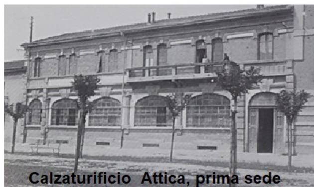
Calzaturificio Attica, prima sede

Grazie all'impiego di scarpe sempre più comode e pratiche – per le donne diverse a seconda del bisogno e dell'occasione – l'industria locale della calzatura, quasi interamente collaborazionista con il regime, non cala e, nel periodo 1931-1935, le cose vanno ancora meglio, grazie alle commesse militari per la preparazione della guerra d'Etiopia. Varie imprese riescono a estendersi su nuovi mercati, così Valenza, grazie all'introduzione di nuove tecnologie e al sapiente utilizzo di materiali innovativi, diventa un centro all'avanguardia nella produzione calzaturiera, con articoli di alta qualità e ricavi consistenti. Detto in altre parole, diversi operai scappano dall'oro verso le scarpe.