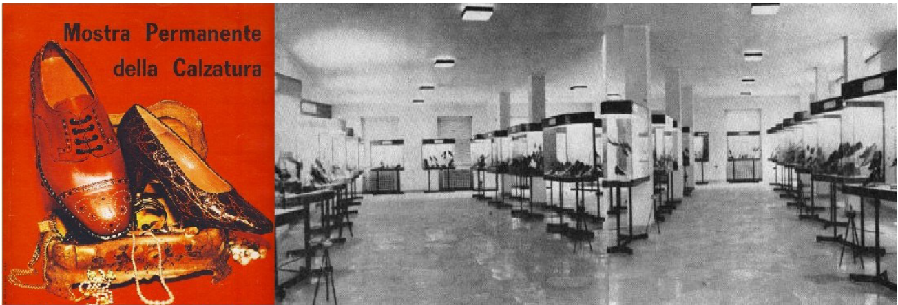
1965 VIA C.ZUFFI 7 VALENZA

Questi i dipendenti dei principali calzaturifici: F.lli Re 169, F.lli Porta 74, Condoral 180, Stella 139, Preferita 30, Provera 45.