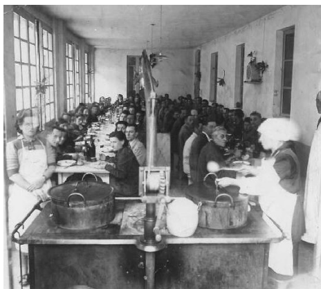
Mensa aziendale al calzaturificio Colombino